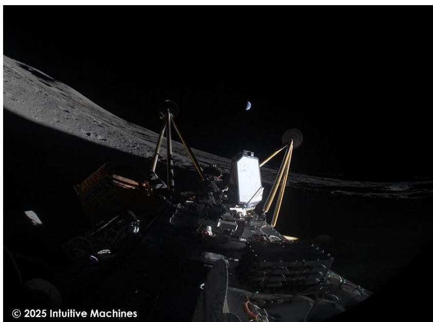
月着陸船 Athena が撮影した月面