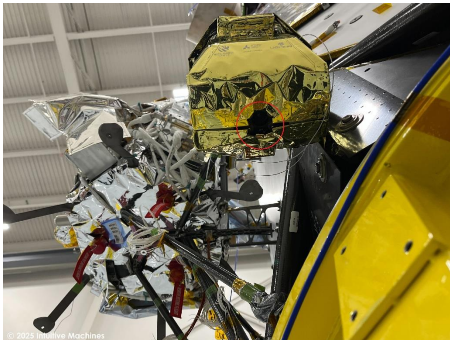
YAOKI のカメラの位置。月面写真はケース内から撮影。