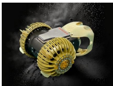
超小型・超軽量・高強度の月面探査車 YAOKI

なお、パンチ工業は、2023 年 5 月 8 日にダイモンと技術パートナー契約を締結し、「Project YAOKI」の一員としてプロジェクトに参画しています。