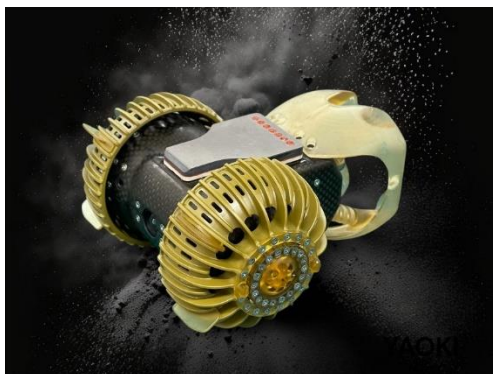
超小型・超軽量・高強度の月面探査車 YAOKI