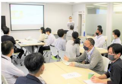
アンコンシャスバイアス研修

全社員を対象とした無意識の根拠のない思いこみや偏見に気付くためのアンコンシャスバイアス研修や、女性社員を講師とした女性活躍推進についての社内セミナーを実施しています。