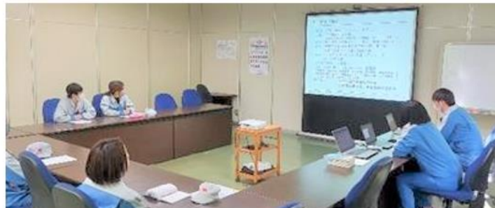
女性活躍推進セミナー