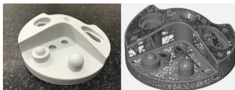
形状を測定し、3D スキャンデータを取得