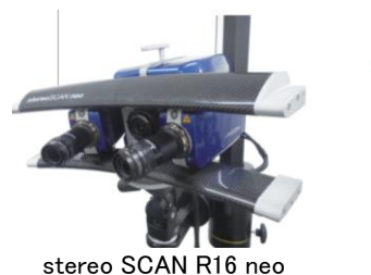
stereo SCAN R16 neo