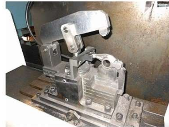
マシニングセンタワーク押え加工治具