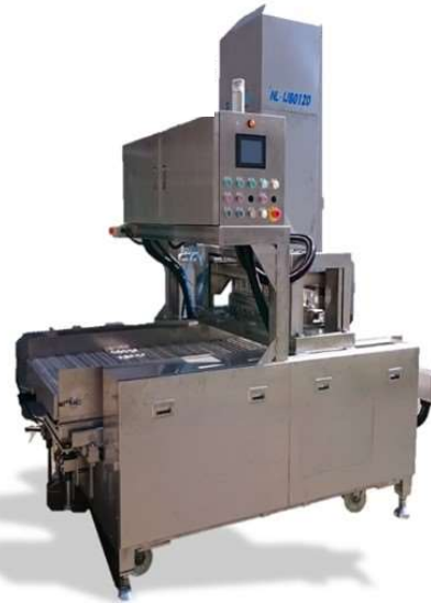
ニードルレスインジェクタ

振動を利用して対象物を 搬送するコンベア トラフに孔をあけて 対象物の分別も可能。